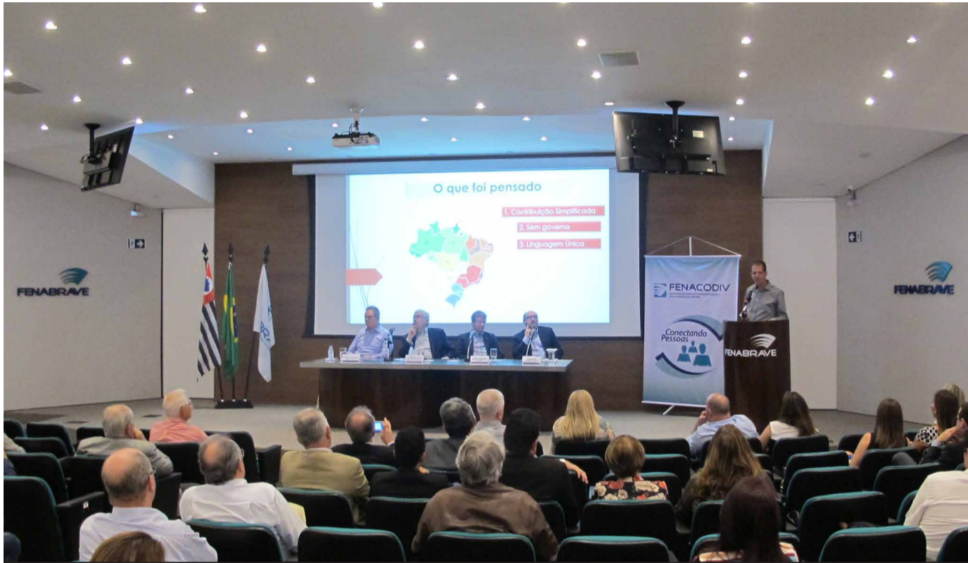
Primeira reunião do ano tratou de assuntos diversos, dentre eles, o balanço das atividades em 2017 e as novidades para 2018.