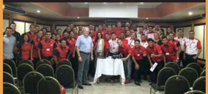
Evento realizado em Belém.