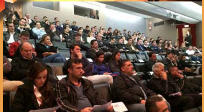
Evento realizado em Curitiba.