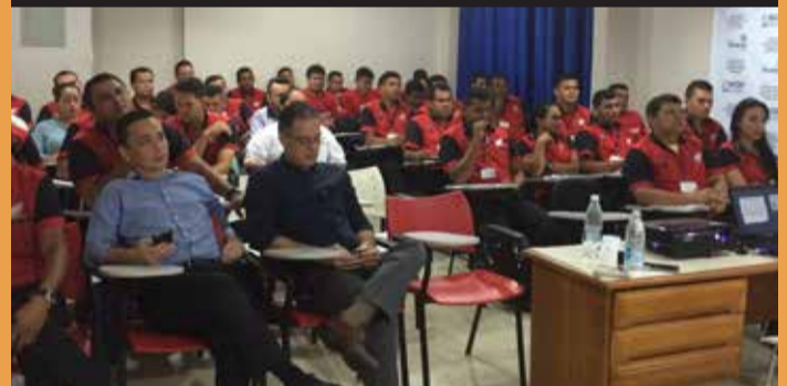
Evento realizado em Macapá.